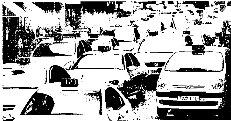
Concentración de taxis, ayer en Castellón, por el asesinato de un compañero en Bilbao.