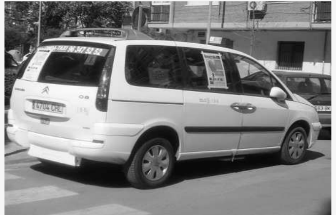
Taxi adaptado para minusválidos

petróleo: Desde un importe mínimo por vehículo de 2.000 € hasta un máximo de 3.000 €.